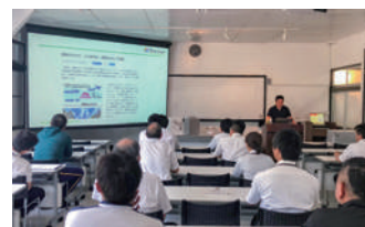
近隣施設にて座学を行います