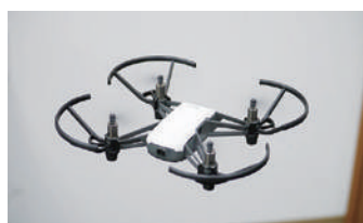
トイドローンで練習やDJI社の他の機体も体験可能