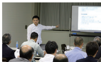
受講前のスクール無料説明会の様子