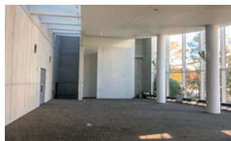
屋内練習場にて実技実習