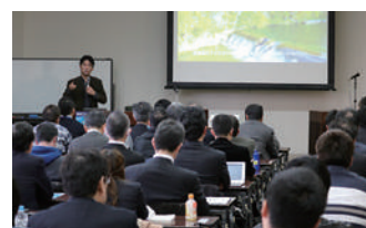
ドローンに関する講演会などイベントも開催!