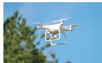
人気の機体で実技実習